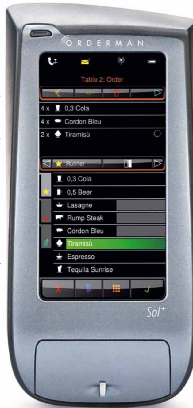
Imagen: Imagen a tamaño real

Interfaz Bluetooth integrada para la conexión de la impresora de cinturón*